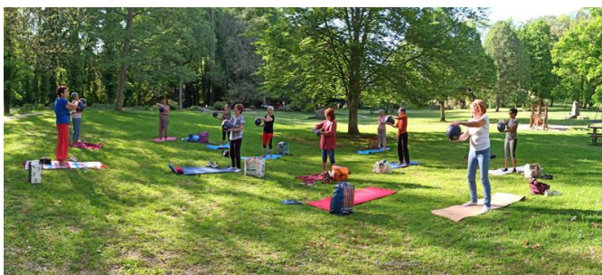
Séance de YOGA en plein air !

Dances en ligne* : groupe Dance l'Ouch21 - Espace Gabriel Moulin, salle EDA